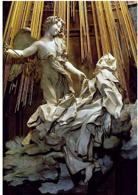
Fig.2 Puntuación máxima. 2 puntos