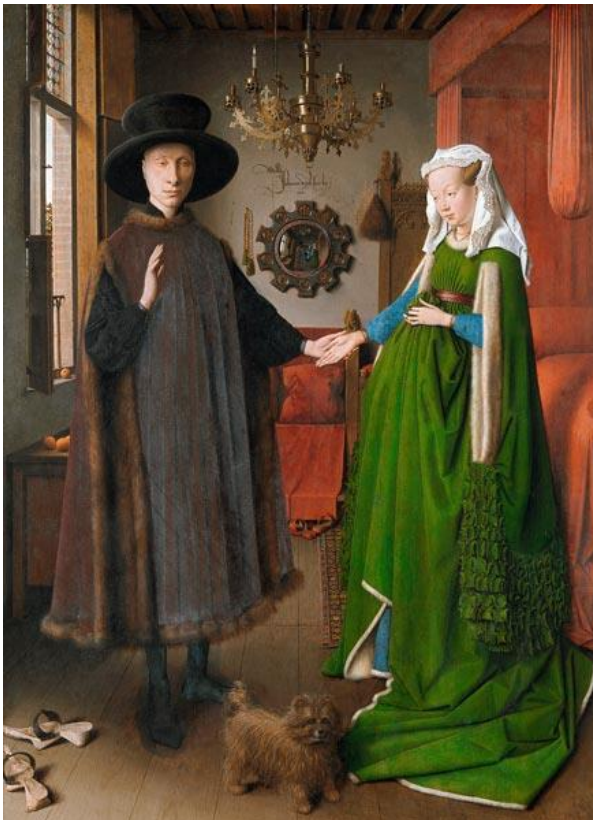
Fig.1 Puntuación máxima. 2 puntos

Analiza y comenta las dos obras de arte presentadas: